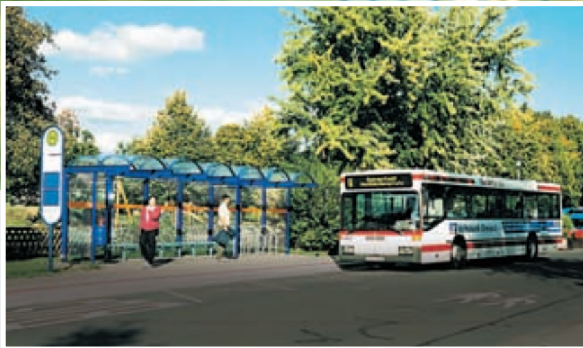
Fahrgastunterstände im Design des RMV (Rhein-Main-Verkehrsverbund)

Dacheindeckung: Acrylglas, transparent klar.